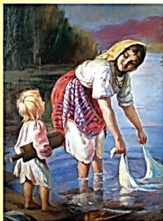
Харитон Платонов. Прачки

«Опять?» – вздыхает мама, когда видит твою испачканную одежду. И тут ей на помощь приходит стиральная машина. Достаточно лишь засыпать моющее средство, нажать кнопку – и через 1–2 часа одежда снова чистая! Но так было не всегда. До того как изобрели такую машину, люди стирали вручную много веков подряд.